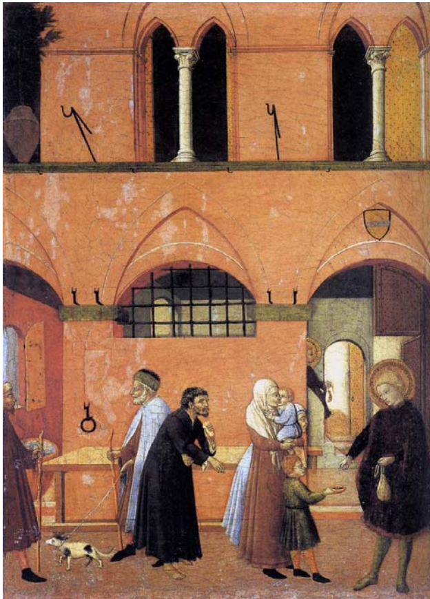
MASTER of the Osservanza St Anthony Distributing his Wealth to the Poor, c. 1440 National Gallery of Art, Washington